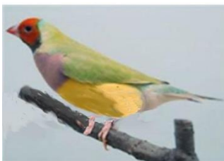
Gouldamadine ( ungarisch dilute )