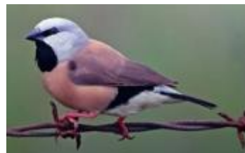
Gürtelgrasamadine ( Poephila cinata )