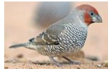
Rotkopfamadine ( Amadina erythrocephala )